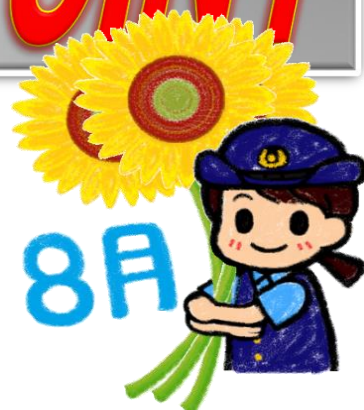
【8月 二輪車死者の年齢別】