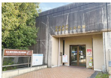
見晴台考古資料館