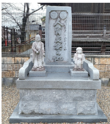
徳川家康公人質交換碑