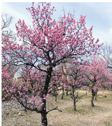
見晴台(笠寺公園)梅林

などの工場で戦前戦後工業地帯としても発展し、ものづくりが盛んな地域でもあります。