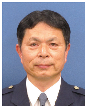
愛知県警察本部交通部長